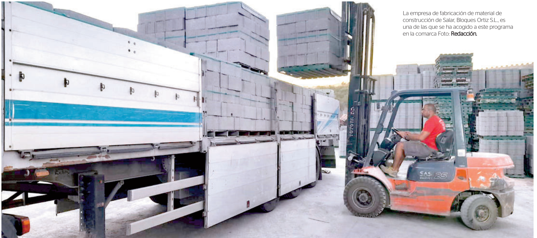
La empresa de fabricación de material de construcción de Salar, Bloques Ortiz S.L., es una de las que se ha acogido a este programa en la comarca

Futuro Joven. Contribuye a invertir la dinámica de despoblamiento rural y a fijar la población joven a los municipios con menor número de habitantes, con 200 ayudas directas a las empresas locales