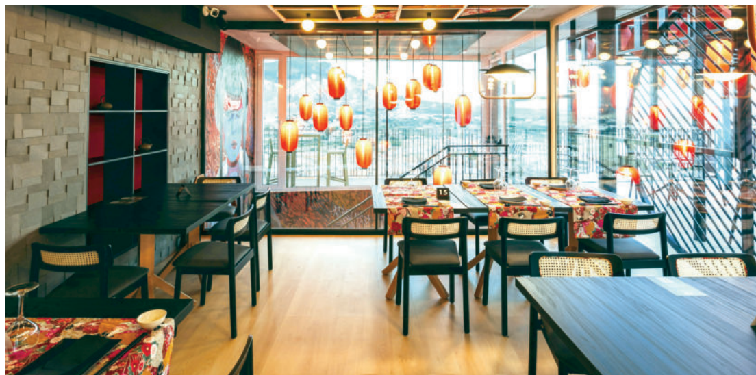
Arriba, imagen del restaurante japonés Mokuren que trae hasta la comarca lo más granado de la gastronomía oriental. Abajo, imágenes de las habitaciones y pasillos del hotel. A la derecha el amplio salón para eventos que ofrece El Mirador.

El éxito de la fórmula de ABQ permitirá a Abades exportarla a otras zonas de Andalucía