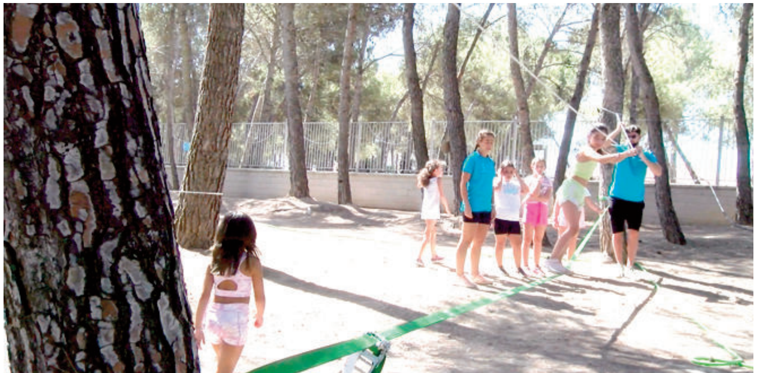
En el pinar de Moraleda de Zafayona se han celebrado varias actividades del campamento de este año

La Escuela de Verano del Ayuntamiento de Huétor Tájar, que se celebra en el Centro de Educación Ambiental Parque Beylar y que sustituye a los tradicionales campamentos (que este año no se celebrarán debido al coronavirus) afron-