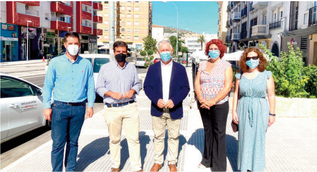
El diputado de Obras y el alcalde de Loja, en el centro, junto al edil de Urbanismo y las representantes del PSOE de Loja.

La institución programa un importante paquete de actuaciones en el municipio, que alcanza 1,5 millones de euros