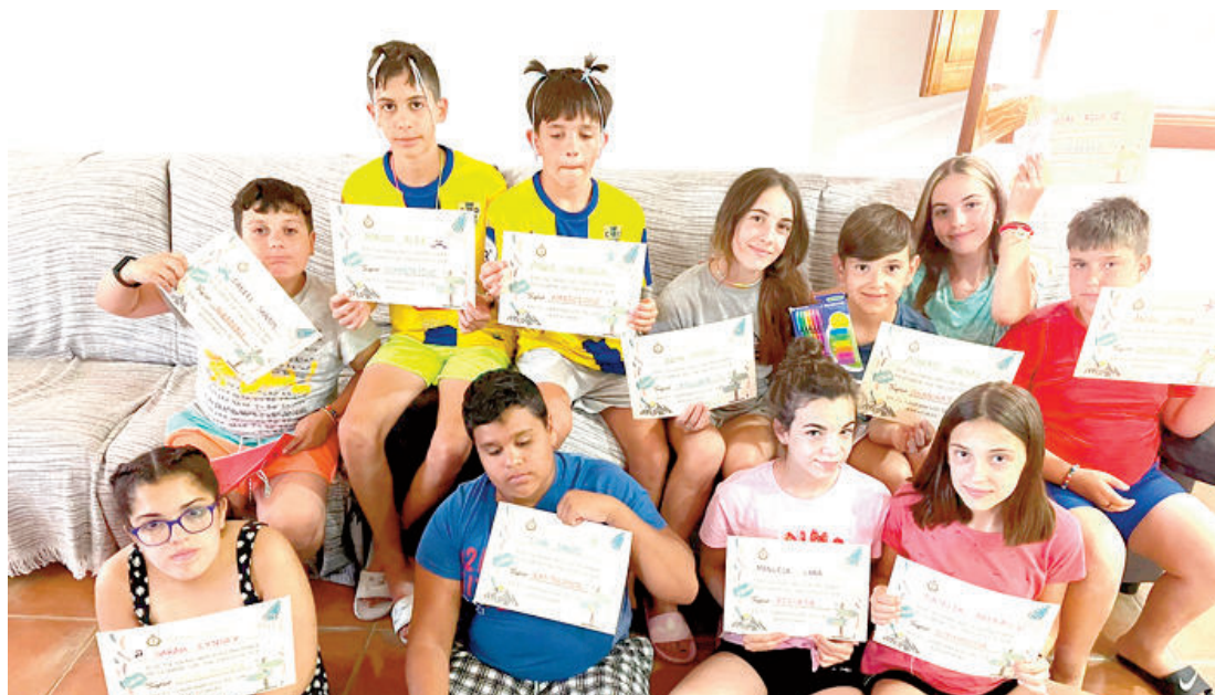
En esta página se muestran algunas de las actividades que se han realizado en el campamento de Villanueva.

En Villanueva se han organizado varias actividades de cocina, manualidades, orientación y acampada