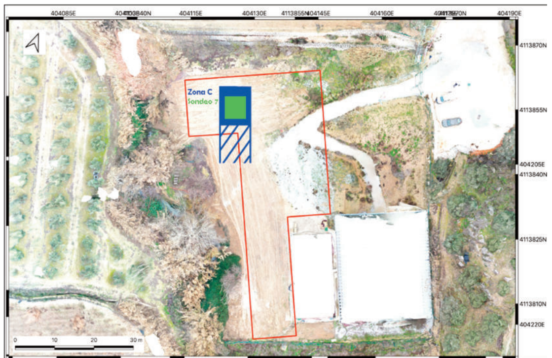
Ubicación del Sondeo 7. Área de excavación C, con espacio rebajado mecánicamente (sólido azul), rampa de acceso (tramado azul) y sondeo arqueológico 7, de 6 x 6 m.

Las personas voluntarias que participan en las campañas Arqueológicas todos los años suelen tener algún alta y baja, en esta ocasión, las incorporaciones de este año son cinco, dos de la Universidad de Granada, uno de la Universidad de Pisa, otro de la autónoma de Madrid y otro de la Universidad de Edimburgo. Asimismo, queremos destacar que la coordinación y asesoría