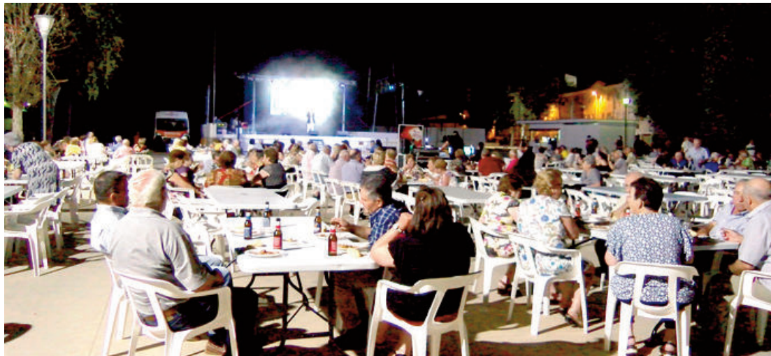
Durante los días de fiesta hubo oportunidad de disfrutar de las terrazas de los bares de Villanueva, la música en directo, la actuación del grupo gaditano de carnaval "Ya son Five" y atracciones para los más pequeños.

Tres grupos musicales en terrazas de bares fue el centro de la emulación de una fiesta tradicional, donde a ritmo de música animaron a todos los presentes en las terrazas.