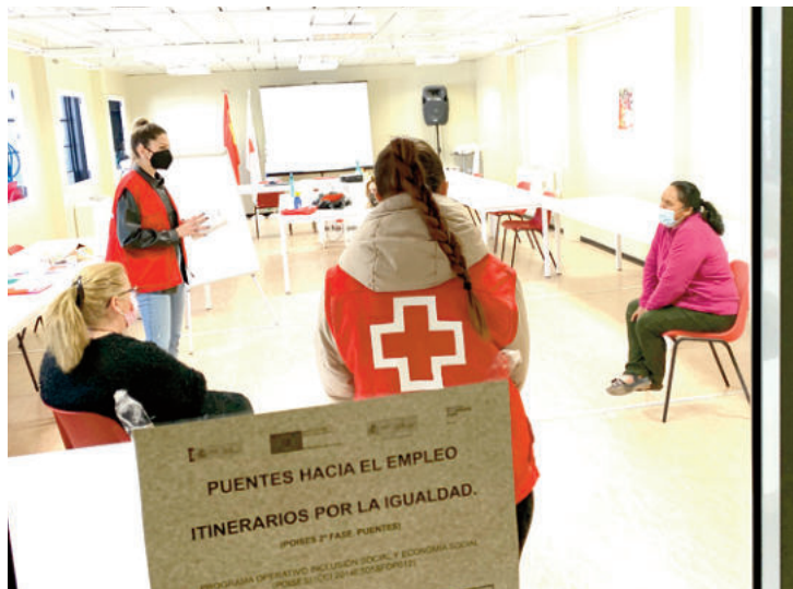
Gracias al Fondo Social Europeo, en la Asamblea Comarcal de Cruz Roja en Loja-Poniente Granadino, estamos llevando a cabo un proyecto denominado “Puentes hacia el empleo: Itinerarios por la igualdad”, que promueve la igualdad de oportunidades y de trato en el mercado laboral.

Sus situaciones de vulnerabilidad y bajos perfiles de empleabilidad hacen necesarias respuestas específicas y especializadas que compensen estas situaciones de desigualdad. La propuesta de trabajo que planteamos se basa en itinerarios por la igualdad complementados con actuaciones que inciden en ámbitos que afectan la empleabilidad de las mujeres. Pero para mejorar la empleabilidad de las mujeres,