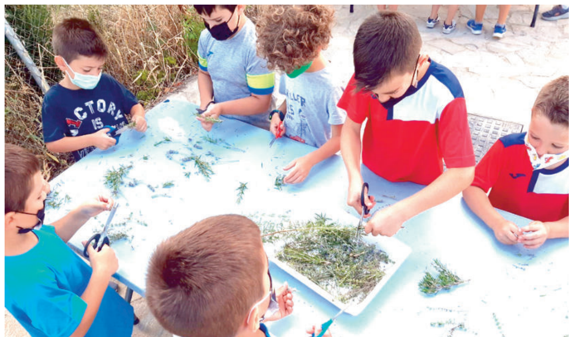
En el Centro de Educación Ambiental Parque Beylar los niños practicarán deportes, juegos, educación en valores, repaso escolar y talleres medioambientales.