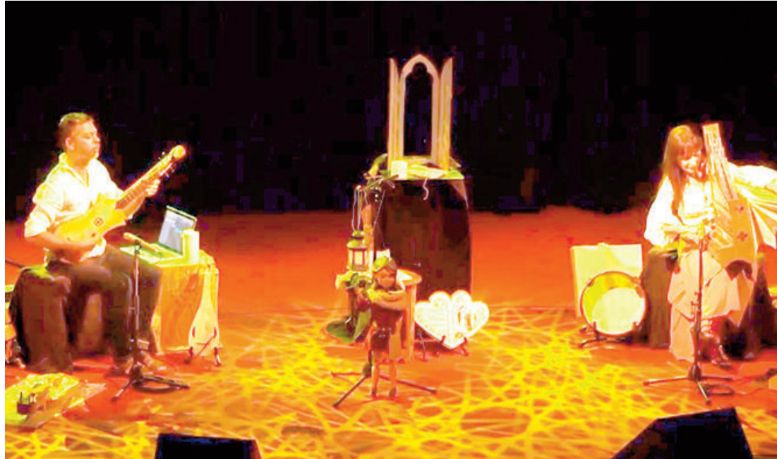
Emilio Villalba y Sara Marina (Sevilla) presentan el espectáculo "La pequeña juglaresa" dentro de la sección "Parapandita".

El festival, cancelado en 2020 debido a la pandemia por coronavirus, está celebrando este año su 30ª edición