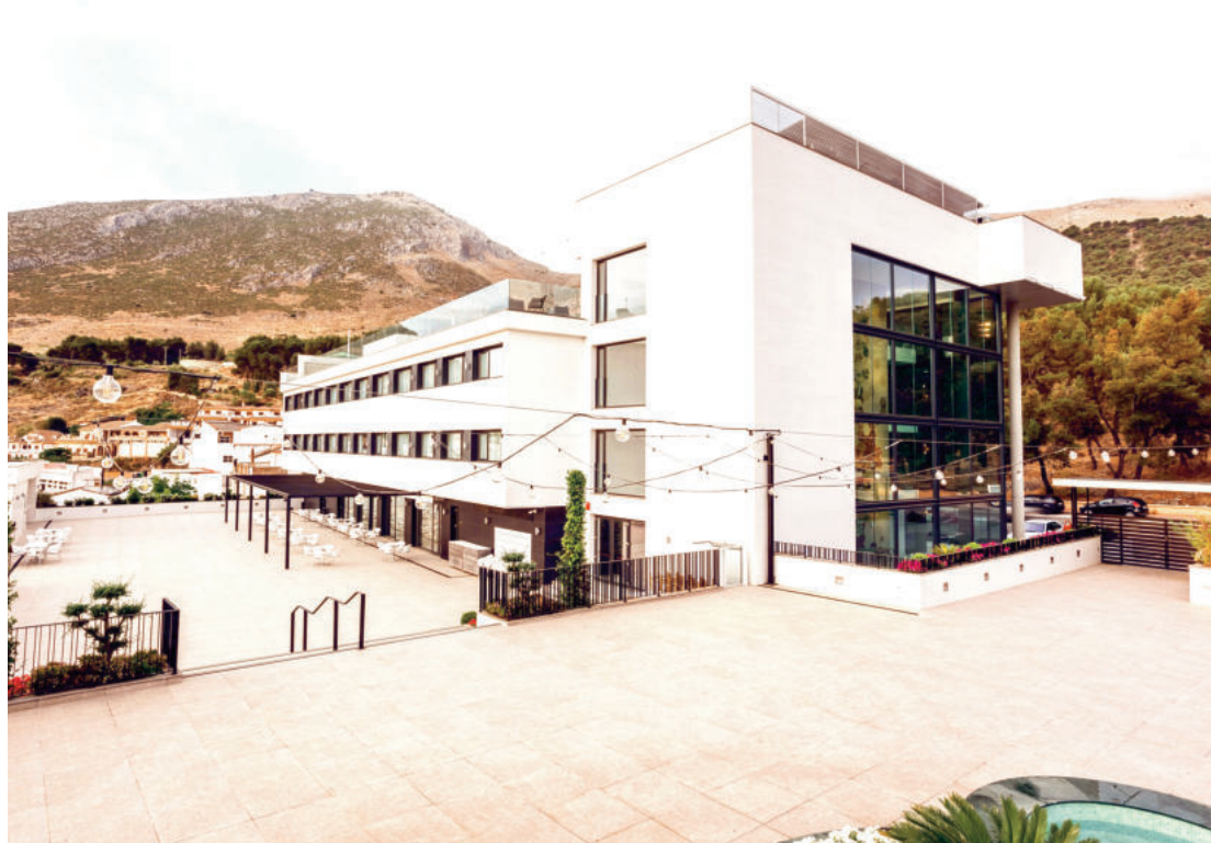
La propuesta de Abades con El Mirador, han convertido al edificio en un espacio multidisciplinar que cuenta con terrazas panorámicas, amplios salones y 60 habitaciones, además de restaurante a la carta, cafetería, spa, gimnasio, discoteca y parking.

Abades reinicia su actividad con una nueva arrocería, un restaurante japonés y la reapertura de El Mirador