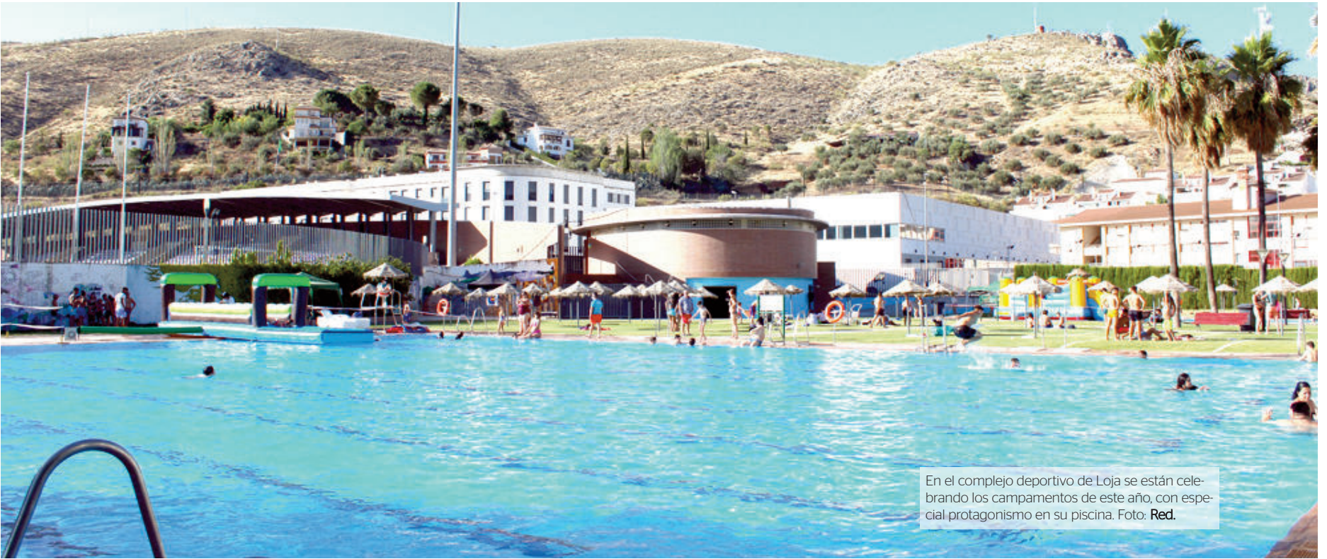
En el complejo deportivo de Loja se están celebrando los campamentos de este año, con especial protagonismo en su piscina.