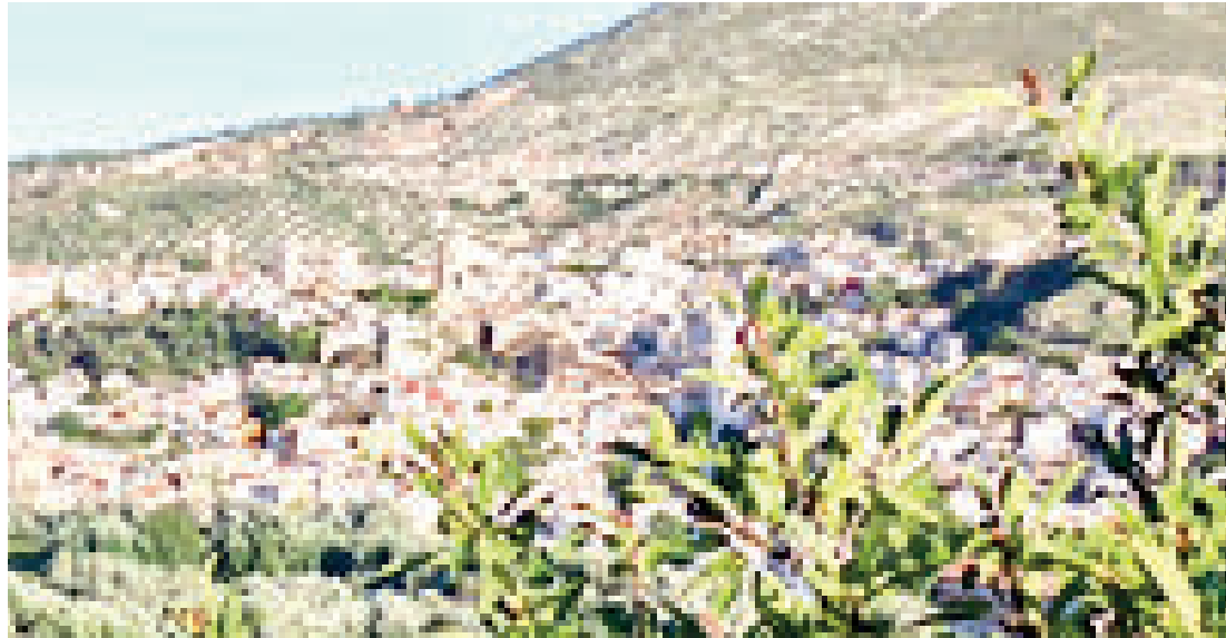
mejorar las condiciones de protección, conservación y puesta en valor del centro histórico de la ciudad, así como de los bienes inmuebles individualizados de interés histórico, arquitectónico civil, arqueológico, etnológico y paisajístico.

A falta de presentación de documentación, se pretende en menos de 12 meses contar con la innovación de este PGOU que fue redactado en el año 2013 y que se ha comprobado que finalmente ha supuesto una sobreprotección que evita la inversión privada en la zona y la huida consecuente de población y comercio. La empresa de arquitectura que ha resultado en un principio, y a falta de algunos trámites, ganadora del concurso propone cinco estudios claves para abordar esta innovación. El primero de ellos, que parte de la idea del sobrecoste de la inversión privada para el mantenimiento y adecuación de edificaciones, se trata del estudio tipológico de los edificios protegidos, hacía una econo-