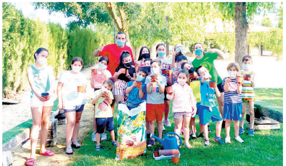
Un total de 36 niños y niñas de entre 5 y 12 años participan en cada turno de esta Escuela de Verano de Huétor Tájar, ya que se han reducido las plazas para garantizar al máximo la seguridad.

Piscinas y ocio. Con las máximas medidas para evitar contagios, los niños del Poniente ya disfrutaban de las actividades de ocio que se están ofertando en los distintos pueblos